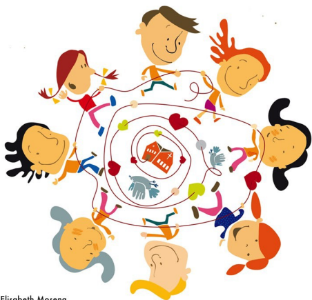
Illustrasjon: Elisabeth Moseng

Men først: Samling tysdag 28. mai, kl. 17.00 - 18.30