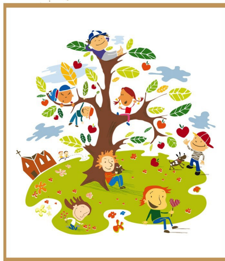
Illustrasjon: Elisabeth Moseng

CD "Alle synger LYSET" blir utdelt under arrangementet til alle "Førsteklasses"-barn.